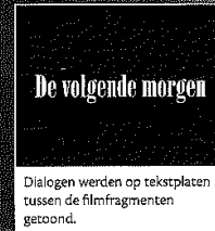
Dialogen werden op tekstplaten tussen de filmfragmenten getoond.