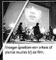
Vroeger speelden een orkest of pianist muziek bij de film.

Het publiek was doodsbang. Ze dachten dat de trein echt naar hen toe reed. Veel mensen renden gillend de zaal uit.